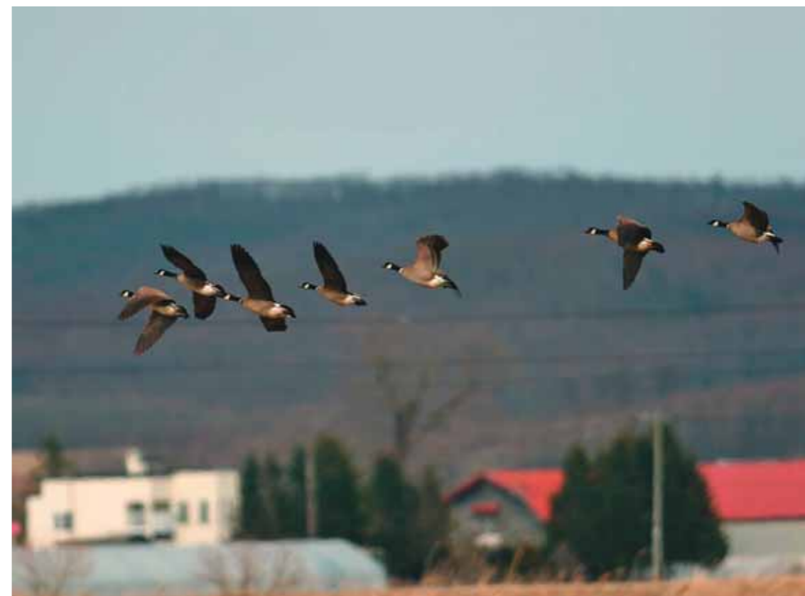
И они таки возвращаются. Япония, о-в Хонсю, 10 апреля 2007 г.

то моё заявление о готовности выполнить едва ли вообще выполнимое отнюдь не опиралось на разум, на трезвые расчёты. Но было огромное желание сделать это, уверенность в своих силах и возможностях, настоящая вера в исполнимость заявленного. Далёкий от политики, мог ли я знать, что живу реалиями, которые в те дни уходили в невозвратную для нынешних поколений историю. И, конечно же, ни я, ни мои коллеги не могли представить тогда глубину пропасти, на краю которой скоро мы, исполнители этой авантюры, окажемся.