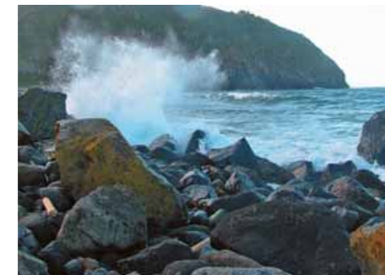
Характерный участок северного «пляжа»

Однако южная, самая непривлекательная для нас его часть была открытой. Вертолёт завис, мы попрыгали в высокую, казавшуюся сухой травянистую растительность, а пилоты ещё несколько минут пытались подыскать в ней подходящую для посадки Ми-8 площадку.