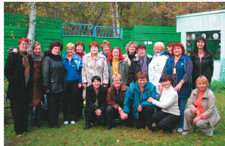
Учителя школ Камчатки

— Нет. У нас не зоопарк, а питомник для разведения редких диких гусей.