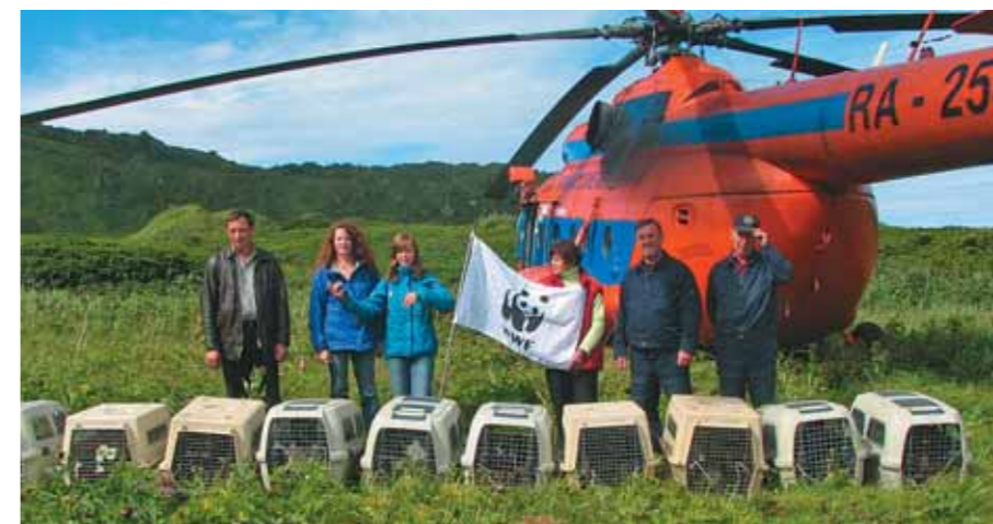
Экарма, год 2005-й

А в последний день этого года мы получили самый драгоценный новогодний подарок — сообщение о прилёте в Японию четырёх наших птиц! Это стало первой на-