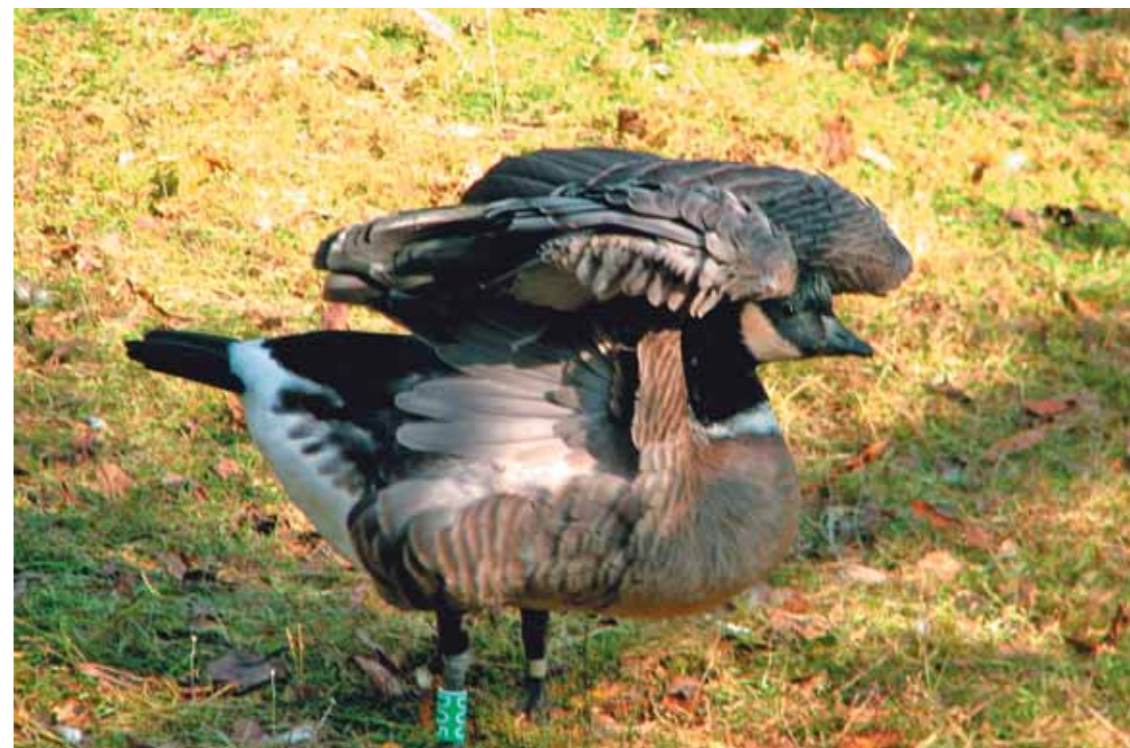
Как бы ей хотелось подняться в небо

Утренние температуры на дворе потихоньку подползают к минусам. А всего