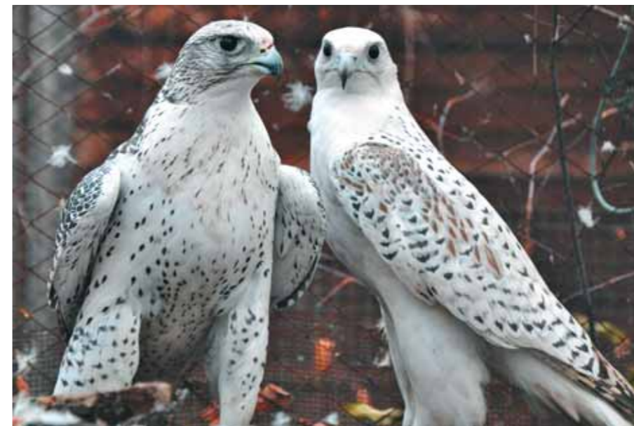
Наши «невольные невольники» — кречеты

Здесь, очевидно, нам пора рассказать о том, что, кроме гусей, в нашем питомнике