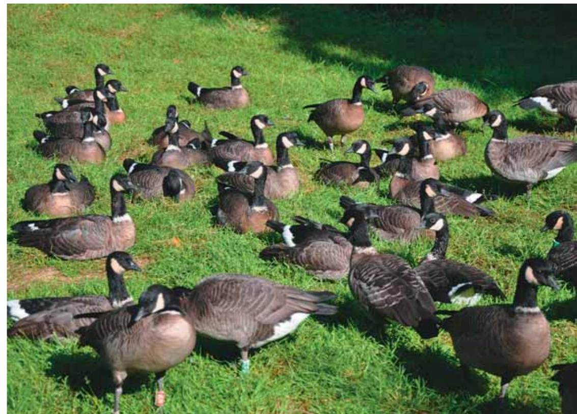
У казарок подрезаны крылья, им предоставлена относительная свобода

Нашим гусям этой осенью лететь куда не предстоит, на одном крыле у них подрезаны маховые перья, но они, похоже, с этим ещё не смирились. Казарки вдруг начинают «лететь» по территории всей стаей. Конечно же, это всего лишь бег с частыми взмахами не способных к полёту крыльев. Иногда спокойно кормящаяся до того на траве стая вдруг, будто чем-то испуганная, вся враз взрывается взметнувшись вверх веерами крыльев. Точь-точно так же взрывоподобно взлетали испуганные тихоокеанскими орланами — Haliaeetus pelagicus чёрные казарки —