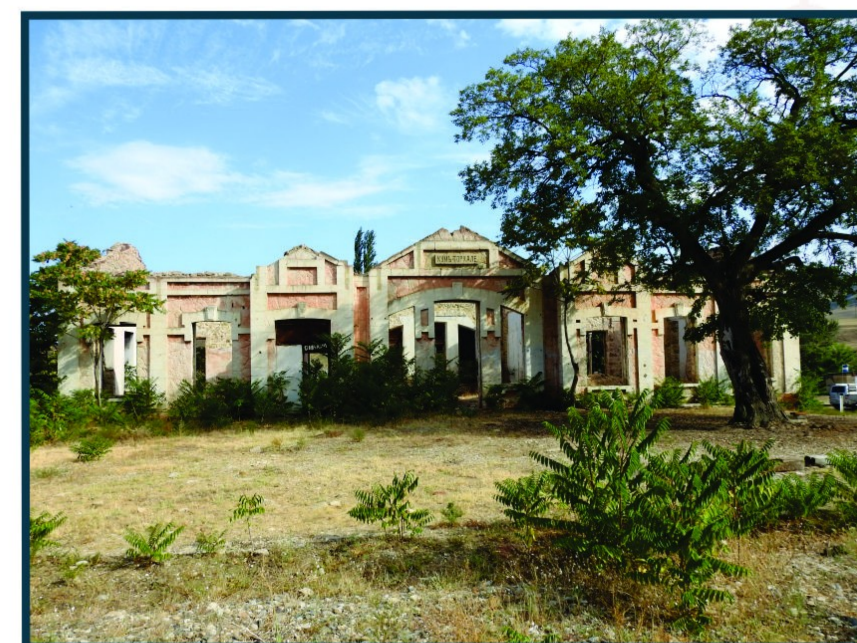
Старое здание вокзала