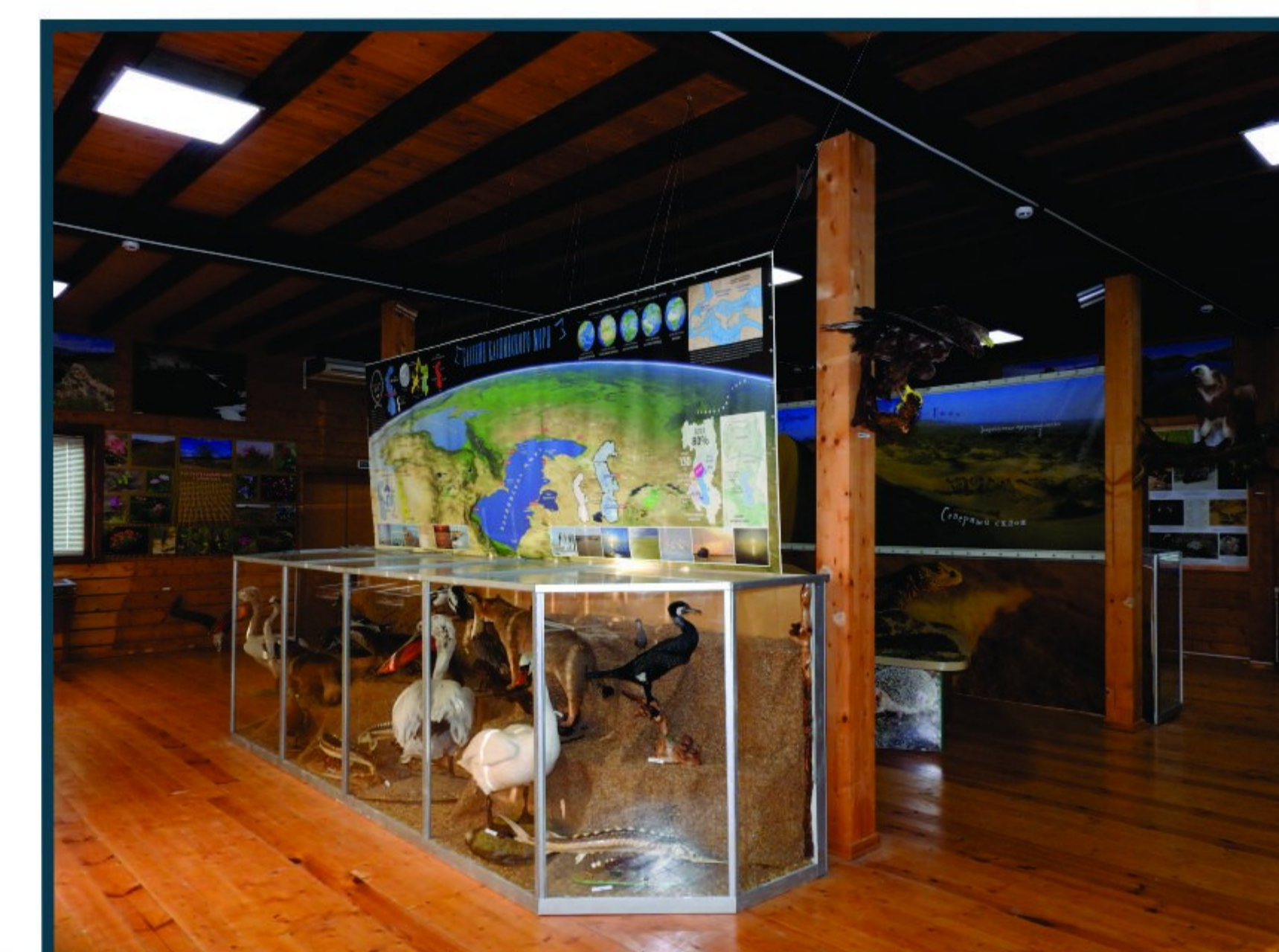
Экспозиции в Музее Природы