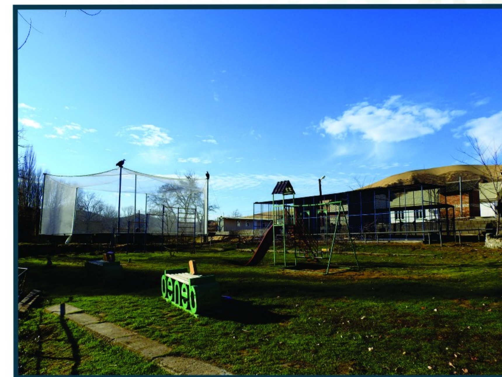
Вольеры и детская площадка